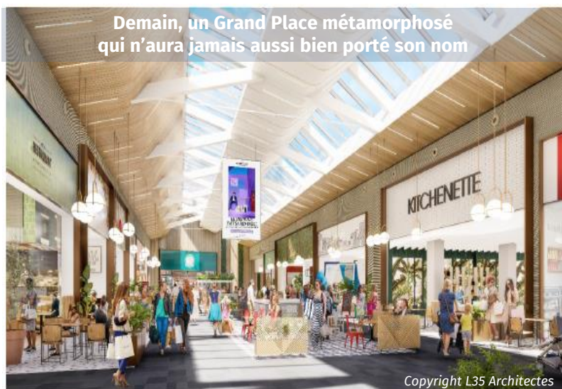
Perspective de l'extension et de ses terrasses extérieures

80 M€ investissements 20 M€ pour la rénovation 60 M€ pour l'extension